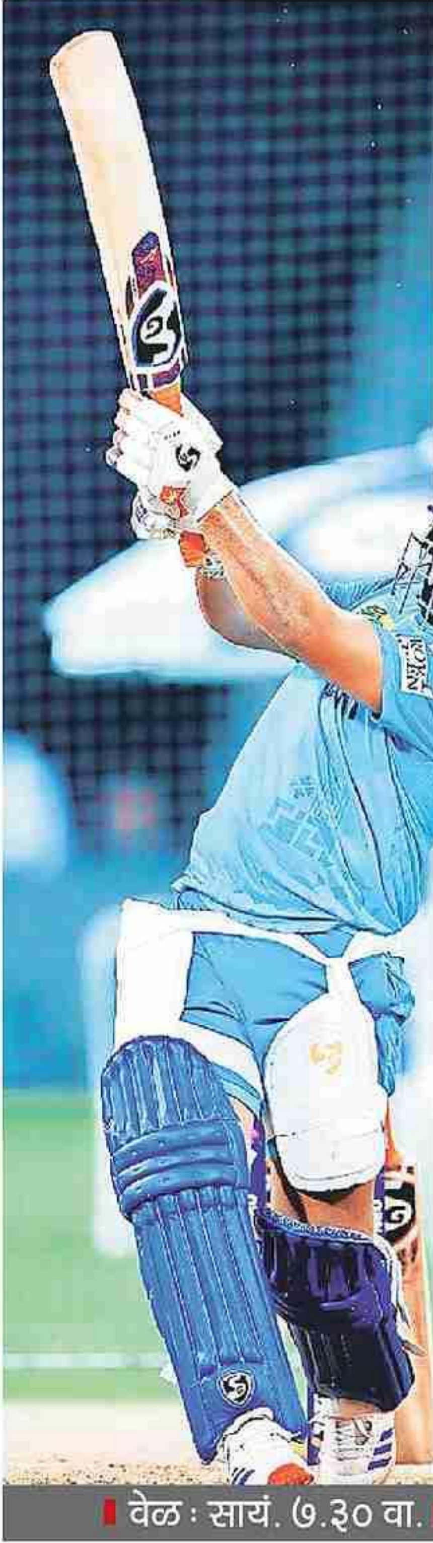
वेळ : सायं. ७.३० वा. थेट प्रक्षेपण : स्टार स्पोर्ट्स ९, ९ हिंदी, जिओहॉटस्टार ऑप.

करता आले आहे. तसेच कर्णधार म्हणून गोलंदाजांची निवड आणि क्षेत्ररक्षकांची रचना यातही तो चुका करताना दिसत आहे. त्यामुळे काही सामन्यांपूर्वी अव्वल चारमध्ये